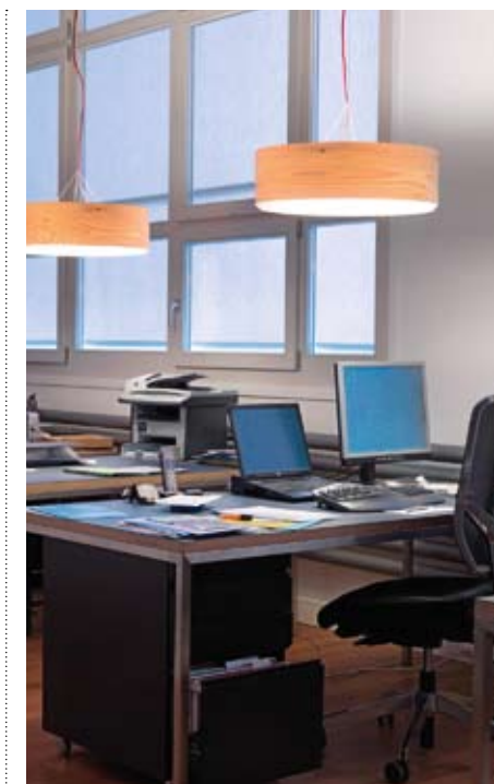
BITTE NEUE LEGENDE, bitte mind. 60 Zeichen (2zeilig)