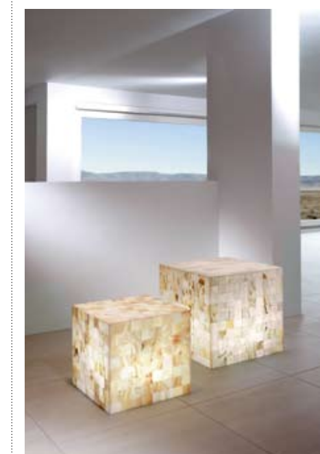
Lichtskulpturen aus weissem Onyx www.artehaus.com

PARAPAN ist ein massives, homogen durchgefärbtes Spezial-Acryl mit brillanter Hochglanz-Oberfläche und Hochglanz-Kante – ohne Lack und in vielen verschiedenen Farben mit unübertroffener Farbstabilität erhältlich. Auf den ersten Blick wirkt es wie perfekt verarbeiteter Schleiflack. Ein attraktives, langlebiges Material, das im Moment gerne für teure Küchen und Badezimmermöbel verwendet wird. Kleinere Schäden können einfach weggeschliffen werden und poliert werden.